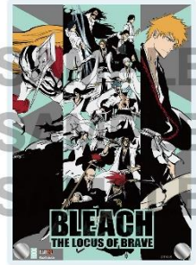
アクリルボード 3,300 円(税込)