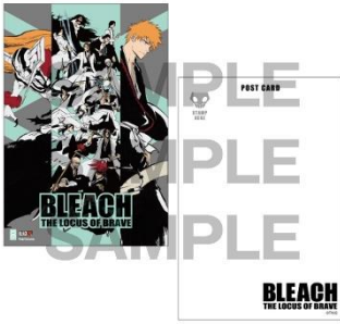
オリジナルポストカード 300 円(税込)