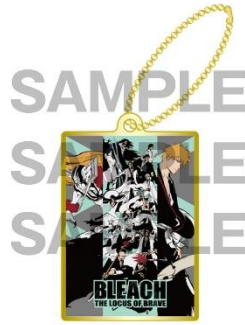
メタルチャーム 900 円(税込)