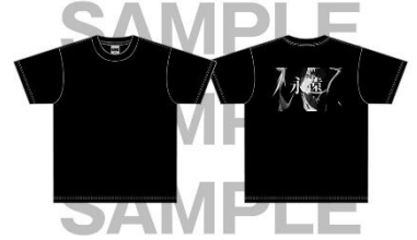
Tシャツ 3,500 円(税込)