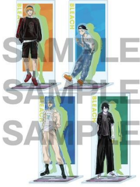
背景付きアクリルスタンド各 2,000 円(税込)