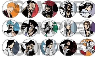
ランダム缶バッジ 各 400 円(税込)