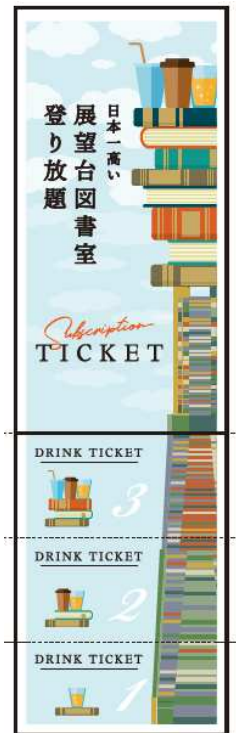
しおりになるパスカードはドリンクチケット付き。

【通常料金】 大人：1,000円／65歳以上・高校生：800円／ 小・中学生：500円／幼児（4歳以上）：200円