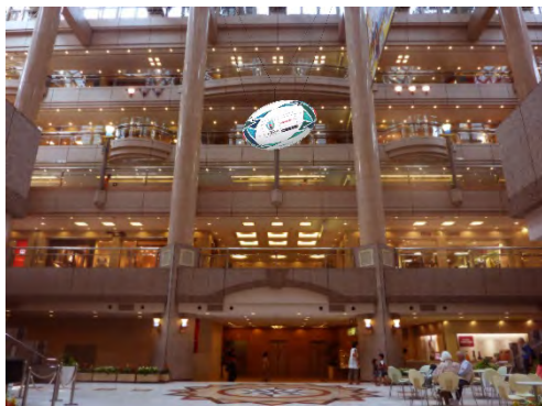
ランドマークプラザ

開催場所：ランドマークプラザ 1F サカタのタネガーデンスクエア、MARK IS みなとみらい グランドガレリア、スカイビル施設外壁