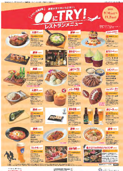
ランドマークプラザ